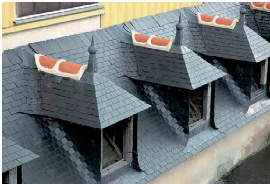
Lucarnes capucines - 2 ème année de BP - CFA St Grégoire (35)